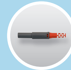
Kelvin- Federkorbstecker Kelvin Lamella-basket Plug