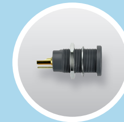
Kelvin- Einbaubuchse Kelvin Threaded Socket